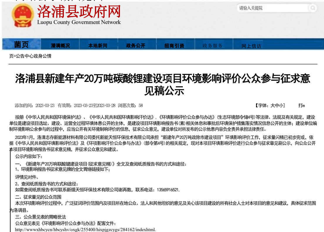
图 1 网上公示截图